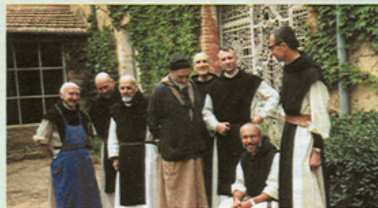
Les moines de Tibhirine, assassinés en 1996.